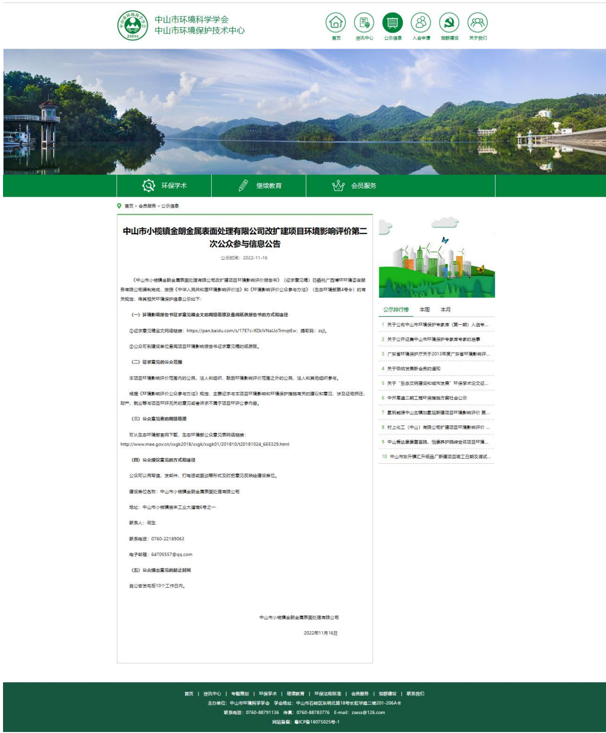
图 3.4-1 征求意见稿网上公示截图