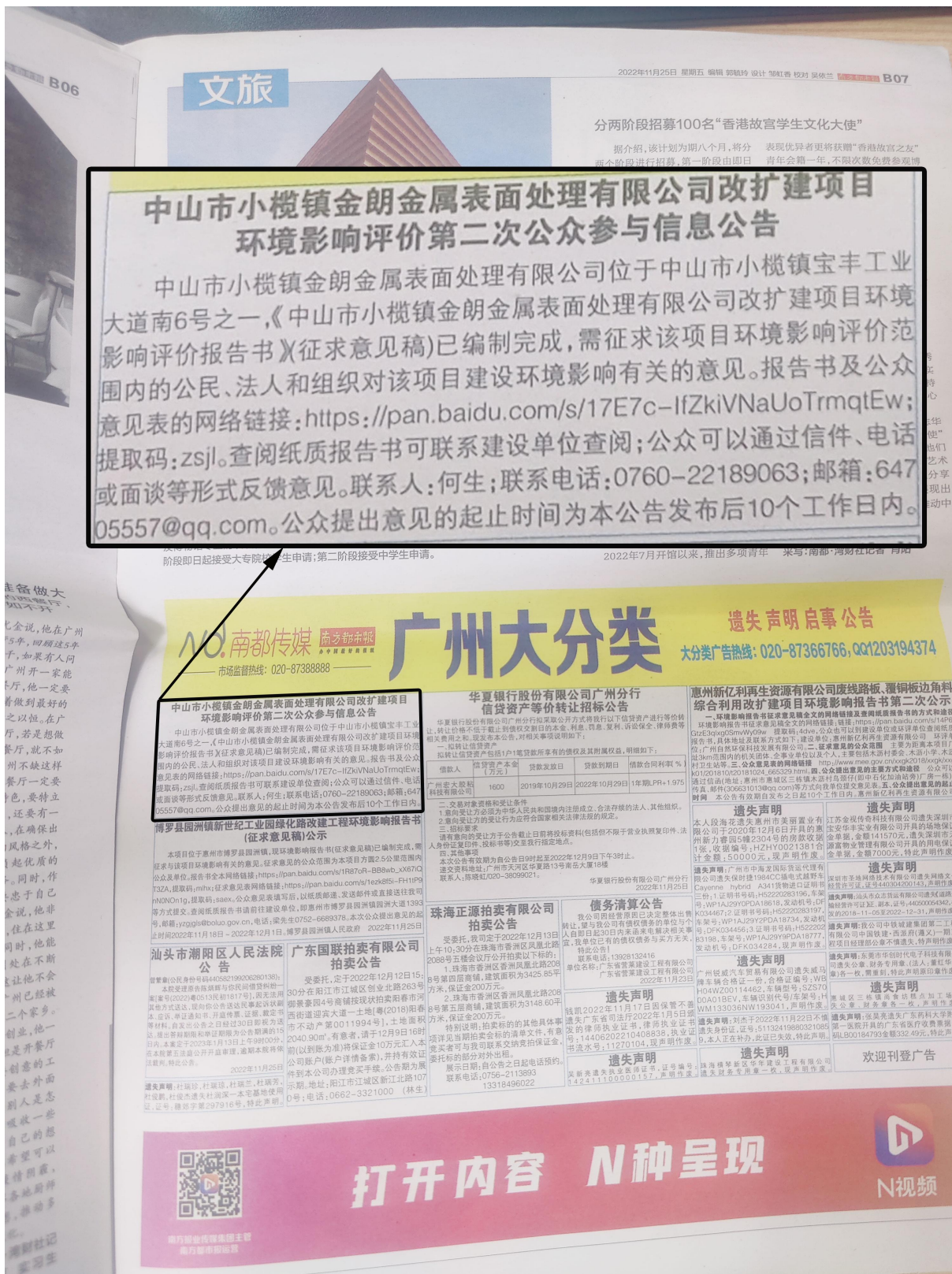
图 3.4-3 征求意见稿报刊公告照片 (2022.11.25)